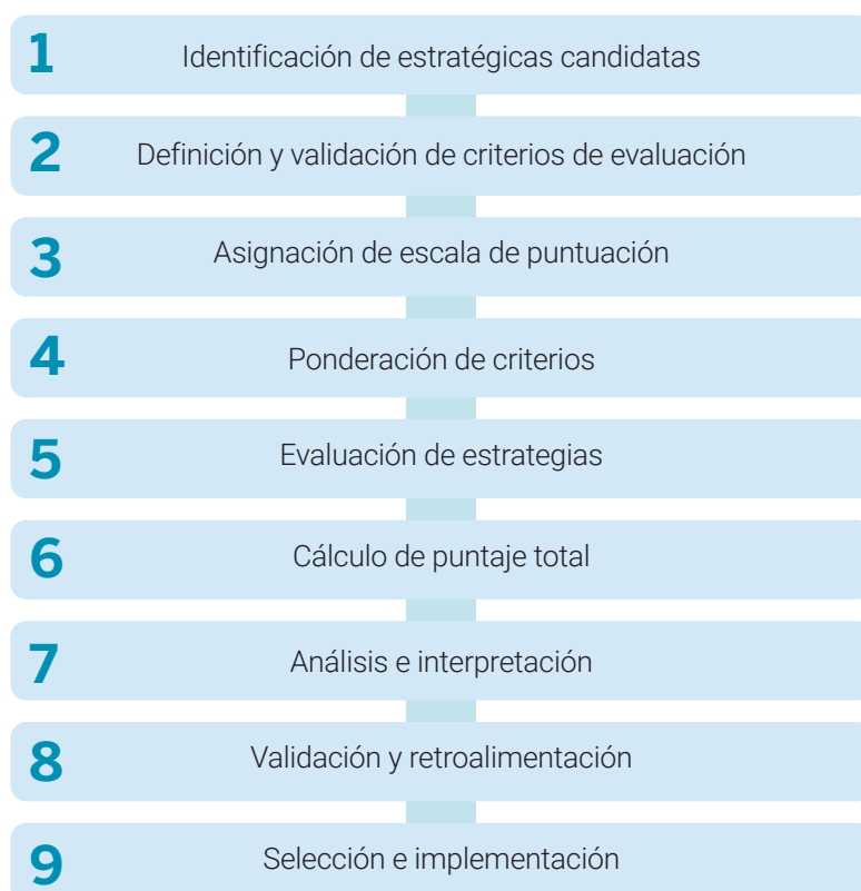
Gráfico 2: Flujoograma para la Evaluación y Priorización de Estrategias de Circularidad