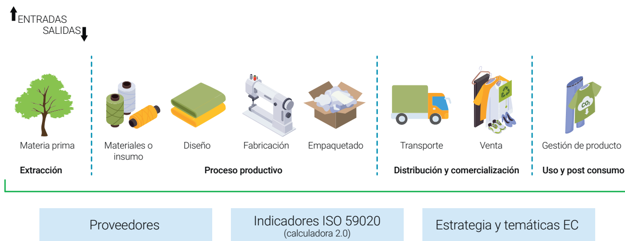
Gráfico 1: Esquema conceptual del ciclo de vida de un producto